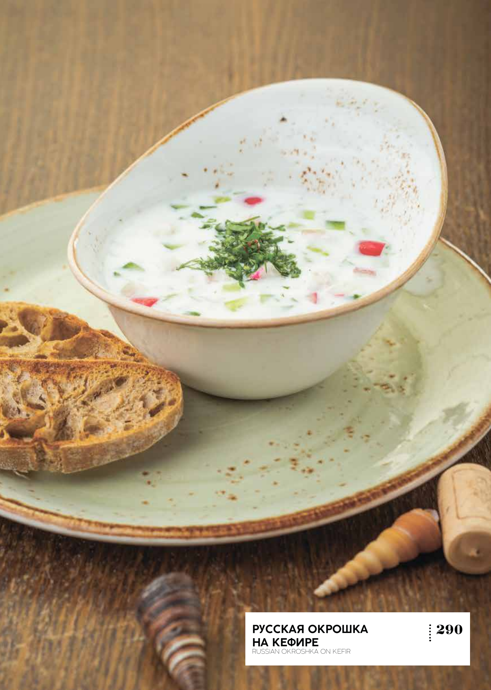
РУССКАЯ ОКРОШКА НА КЕФИРЕ : 290 RUSSIAN OKROSHKA ON KEFIR