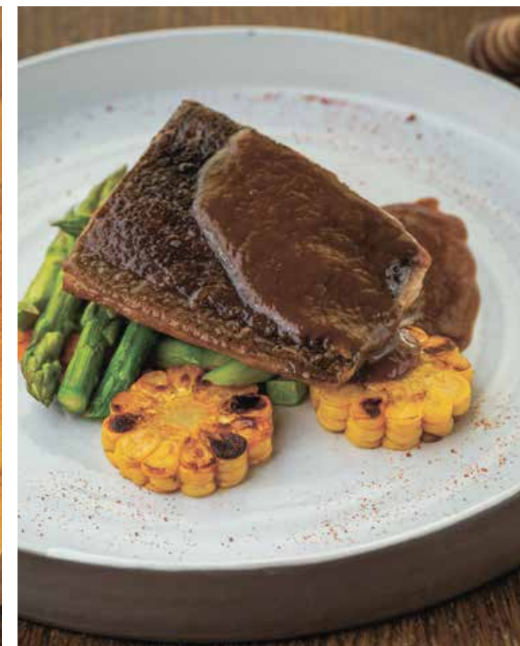
АФРИКАНСКИЙ СОМ СОВОЩАМИ И ТАМАРИНДОВЫЙ СОУСОМ AFRICAN CATFISH