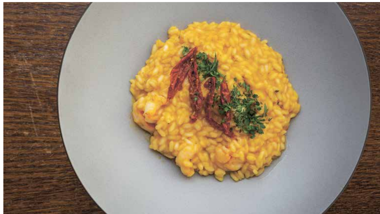
РИЗОТТО С ТЫКВОЙ И КРЕВЕТКАМИ RISOTTO WITH PUMPKIN AND SHRIMP