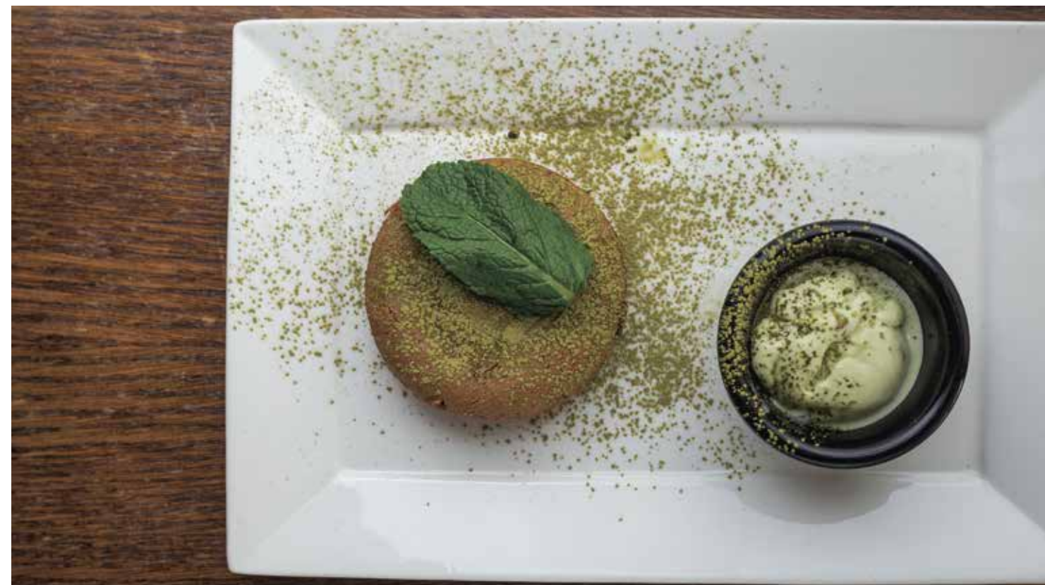
ЧАЙНЫЙ ФОНДАН : 230 TEA FONDANT