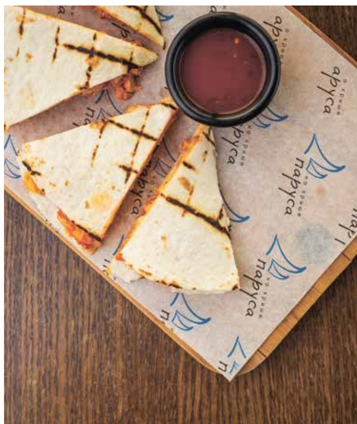
КЕСАДИЛЬЯ С КУРИЦЕЙ QUESADILLA WITH CHICKEN