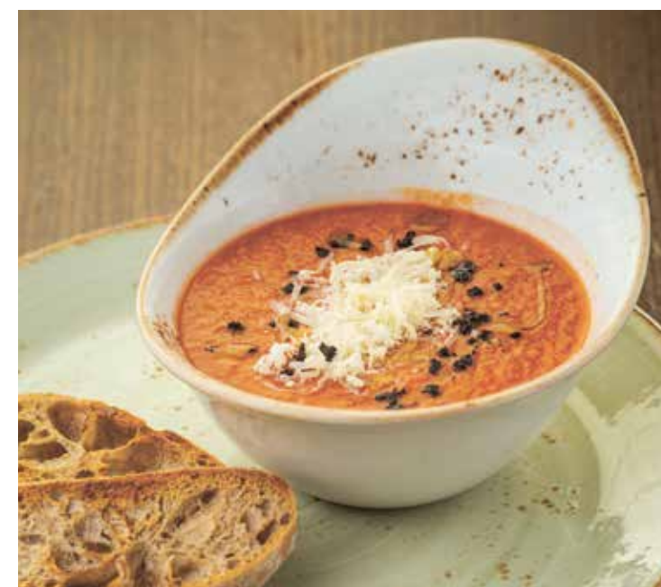
ГАСПАЧО С ЧИАБАТТОЙ : 490 GAZPACHO WITH CIABATTA