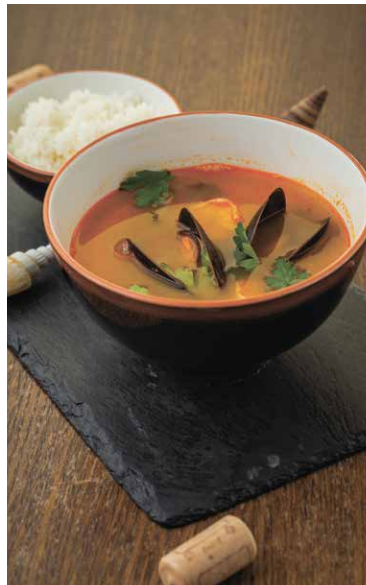
СУП БИСК С МОРЕПРОДУКТАМИ : 290 BISQUE SOUP