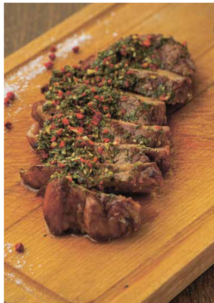
СТЕЙК СТРИПЛОЙН С СОУСОМ ЧИМИЧУРРИ STEAK STRIPLOIN