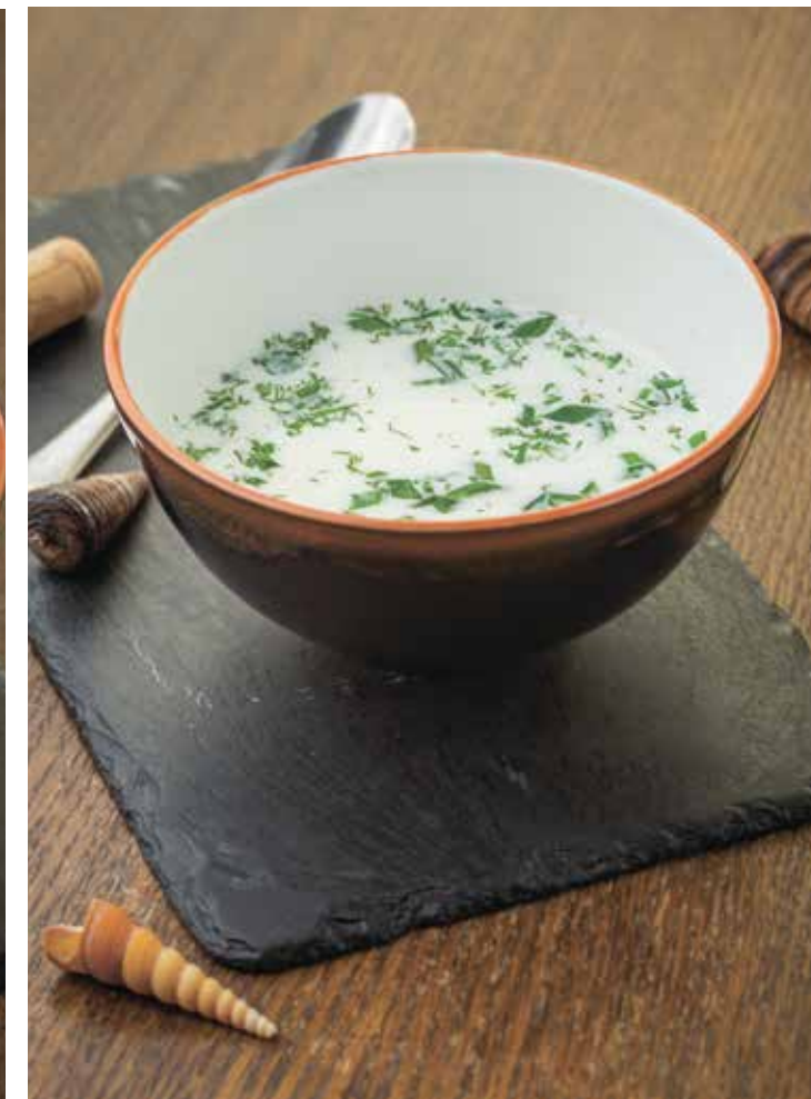
УХА ПО-ФИНСКИ : 490 EAR IN FINNISH