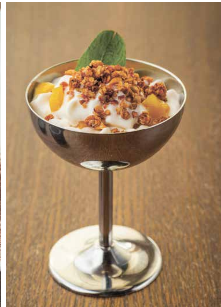
МУСС ИЗ РЯЖЕНКИ С ПЕРСИКАМИ И ГРАНОЛОЙ : 220 MOUSSE OF SOUR MILK