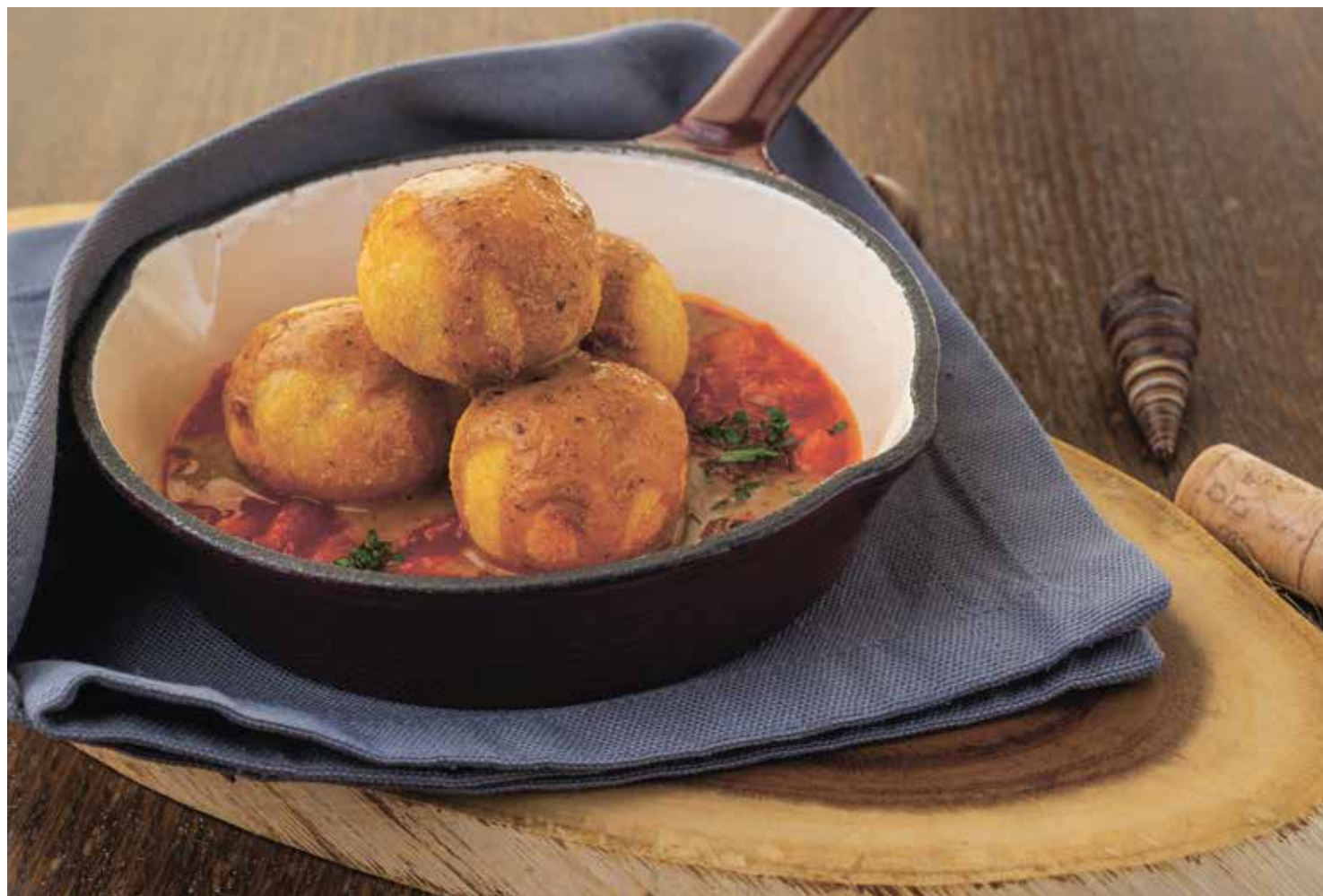
МИТБОЛЫ С ОВОЩАМИ И СОУСОМ ДЕМИГЛАС MEATBALLS WITH VEGETABLES