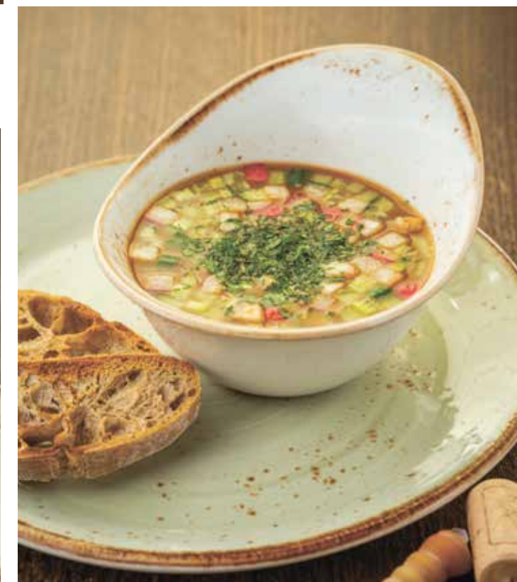
РУССКАЯ ОКРОШКА НА КВАСЕ : 290 RUSSIAN OKROSHKA ON KVASS