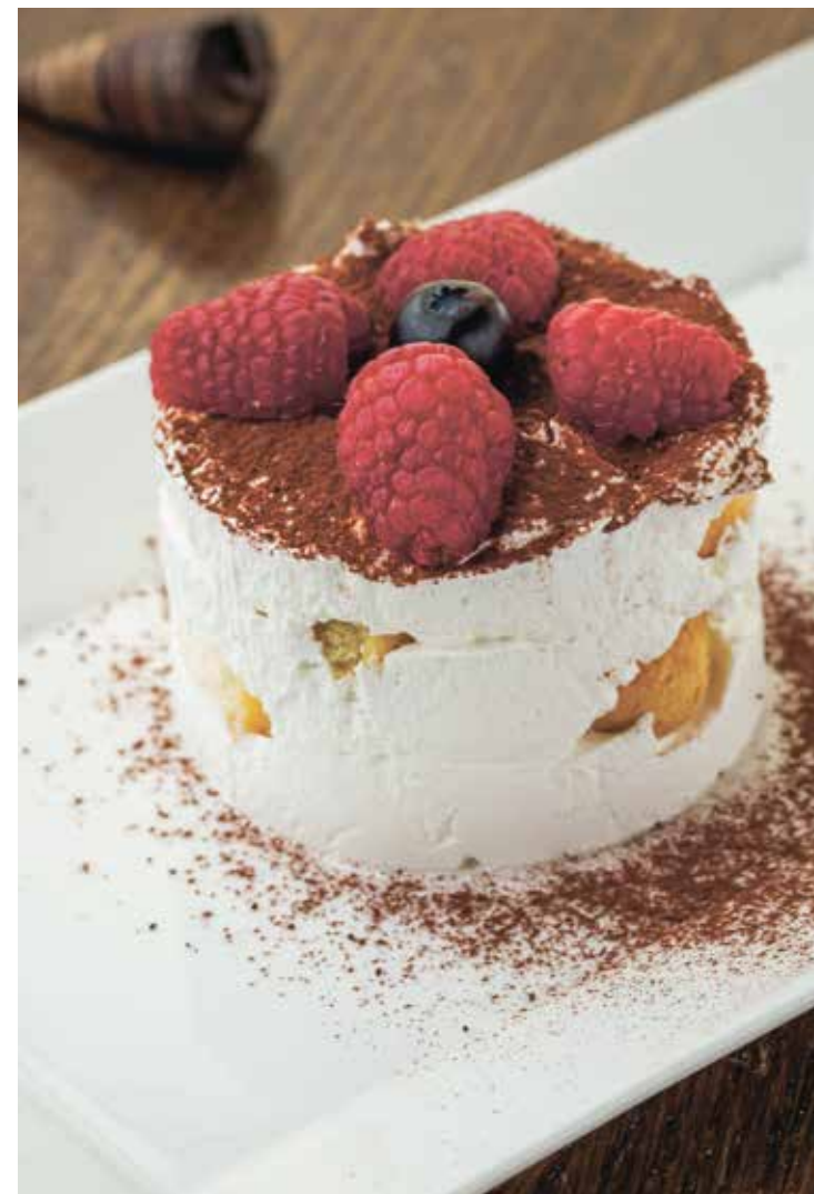
ТИРАМИСУ : 320 TIRAMISU