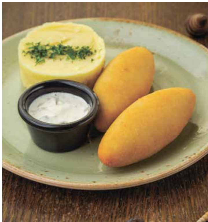
КОТЛЕТЫ ПО-КИЕВСКИ CHICKEN KIEV