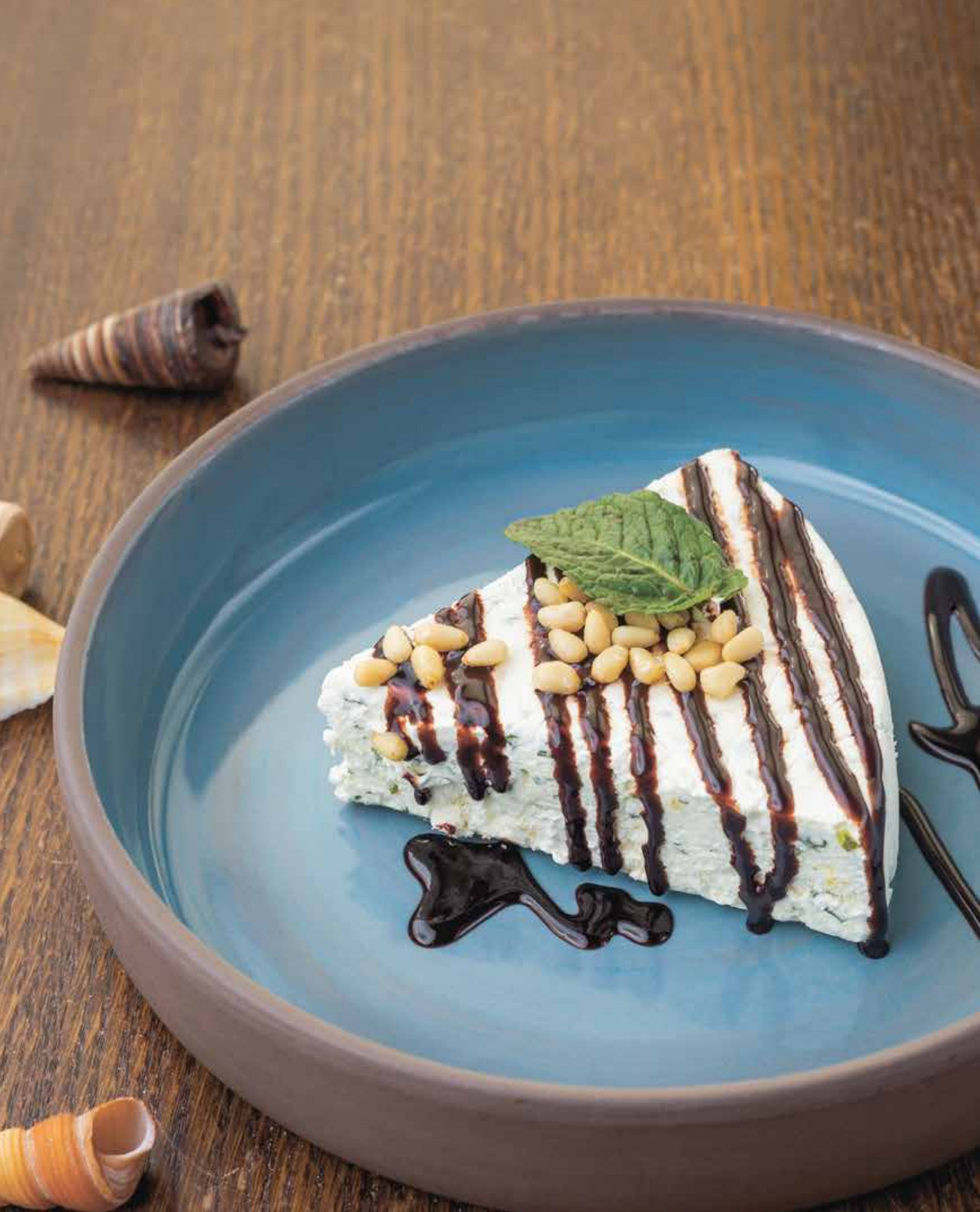
СЕМИФРЕДО С БАЗИЛИКОМ : 290 SEMIFREDDO