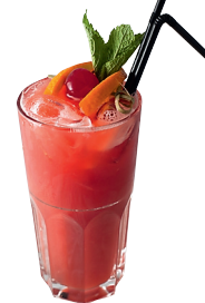
«Оранжевое солнце» Сок персиковый, сок ананаса, смородиновый сироп. «Две палочки»