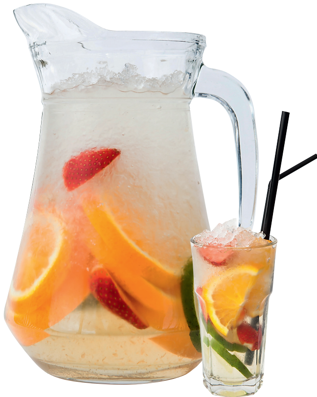
Лимонад «Облепиха с цитрусом» Облепиха, протертая с сахаром, апельсин, грейпфрут. «Макаронники»