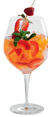
Летняя сангрия Игристое вино, свежие фрукты. «Zimaleto»