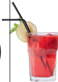
Лимонад клубничный Клубника, лайм, газированная минеральная вода. «Паруса»