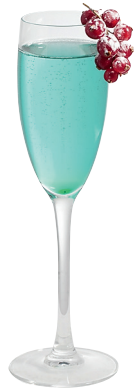
Коктейль Jade Дынный ликер Midori, сироп Blue Curacao, сок лайма, ангостура, шампанское Ruinart brut. «Бельвю Брассери», отель Kempinski

бутылок — примерно столько было выпито в «Макаронниках» самого популярного вина пино гриджио