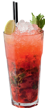
Клубничный безалкогольный мохито Сок лайма, клубничный сироп, мята, долька лайма, вода с газом, свежая клубника. «Гимназия»