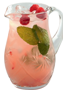
Лимонад Пюре из ежевики, и малины, свежавыжатый лимонный сок, сахарный сироп. «Любимое место 22.13»