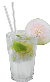
Лимонад «Яблоко с корицей» Яблоко, корица, лед, газированная минеральная вода, сироп. «Фартук»