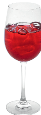
Домашний морс из сезонных ягод «Эларджи»