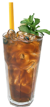
Холодный чай из плодов шиповника «Русская рыбалка»